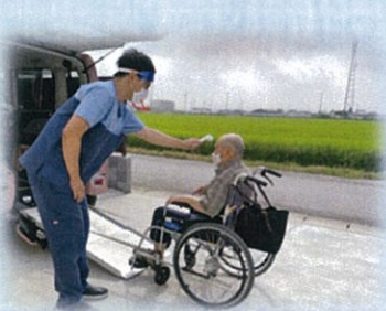
送迎車に乗る前に検温実施