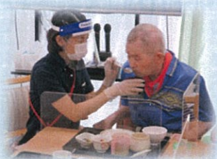
排泄・食事・入浴の介助時ではゴム手袋使用