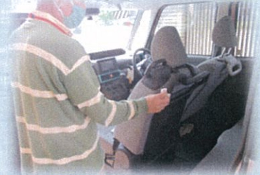
行き・帰りの送迎後に手すりなど消毒