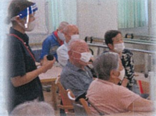
職員はフェイスシールドとマスク着用