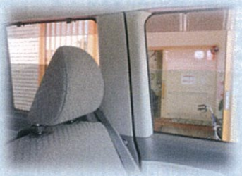
換気をしながら送迎実施