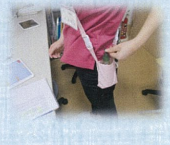
職員はアルコール消毒を持参