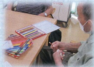
利用者様と一緒に物品の消毒