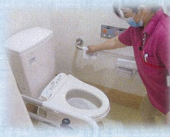
トイレなど手すりの消毒