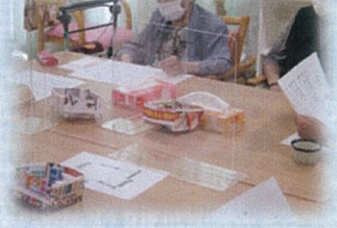
飛沫感染予防の亚克力板