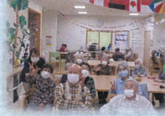
利用者様のマスク着用